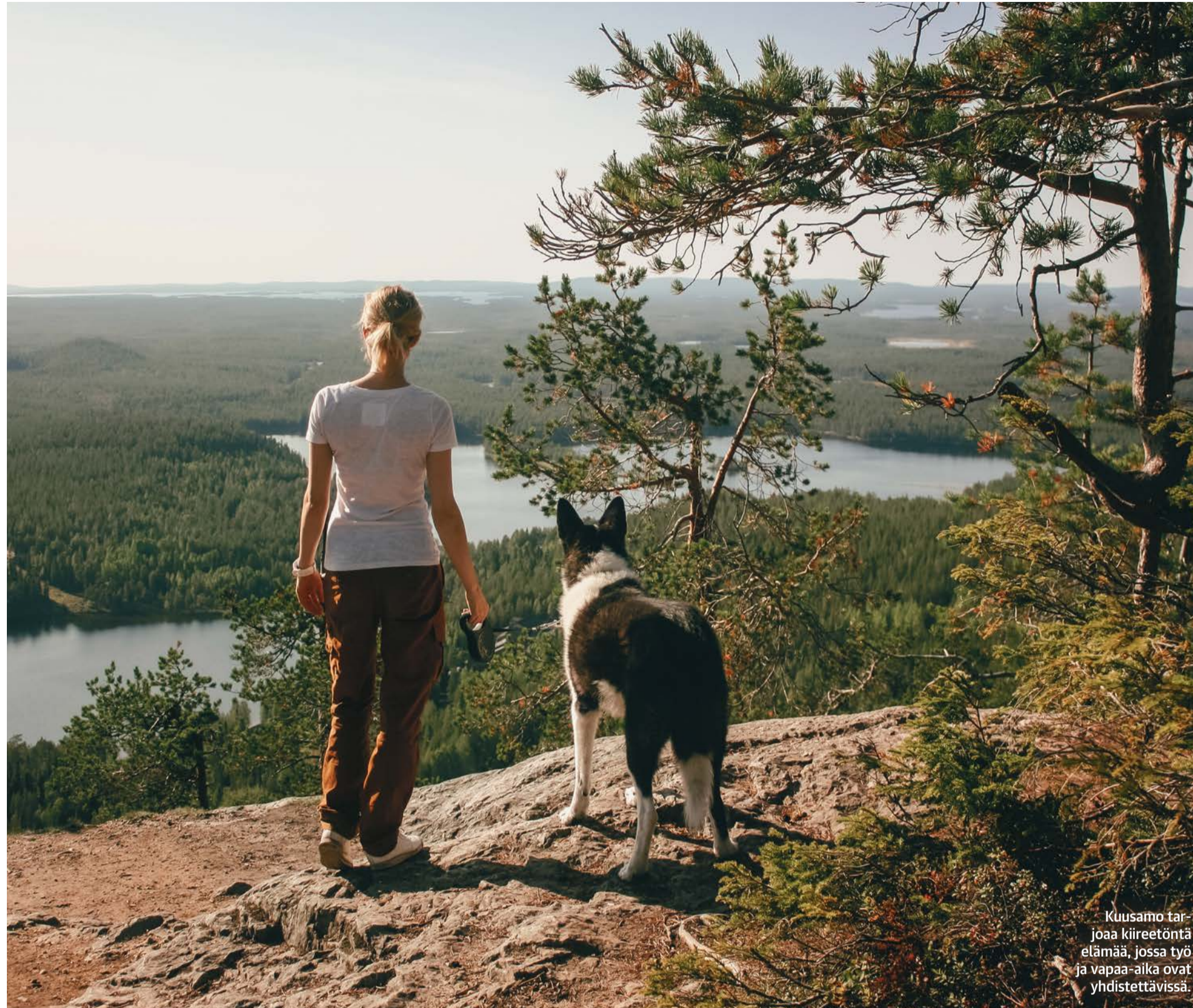
Kuusamo tarjoaa kiireetöntä elämää, jossa työ ja vapaa-aika ovat yhdistettävissä.

- Luontomatkailu ympärivuotisesti kiinnostaa ihmisiä yhä enem-