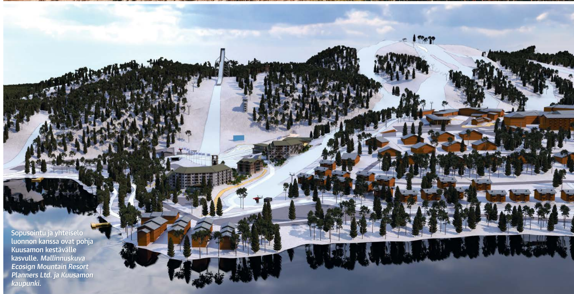
Sopuointu ja yhteiselo luonnon kanssa ovat pohja Kuusamon kestäväälle kasvulle. Mallinnuskuvaa Ecosign Mountain Resort Planners Ltd. ja Kuusamon kaupunki.

män, ja Kuusamossa on siihen hyvät puitteet ja palvelutarjonta. Kaupungin väestönkehitys on pitkään ollut laskussa, mutta viime vuosina lasku on pysähtynyt, Kymäläinen toteaa.