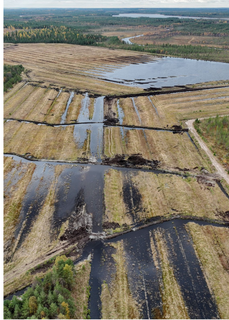
Raakunsuo, Ranua, 124 ha