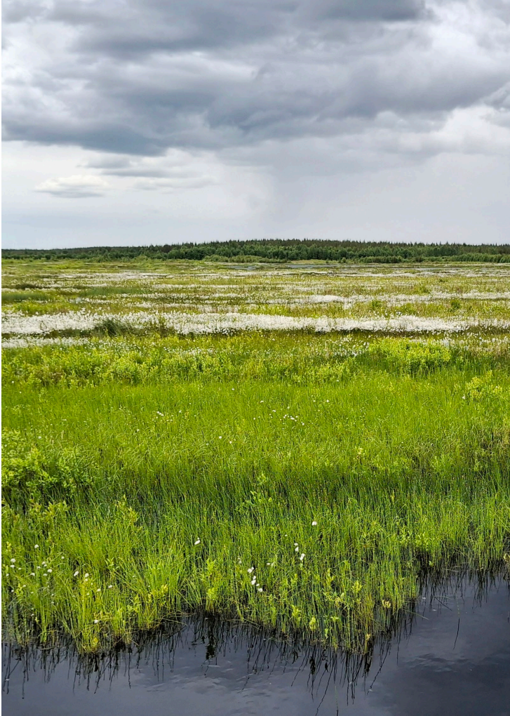
Karsikkosuo, Ranua, 76 ha