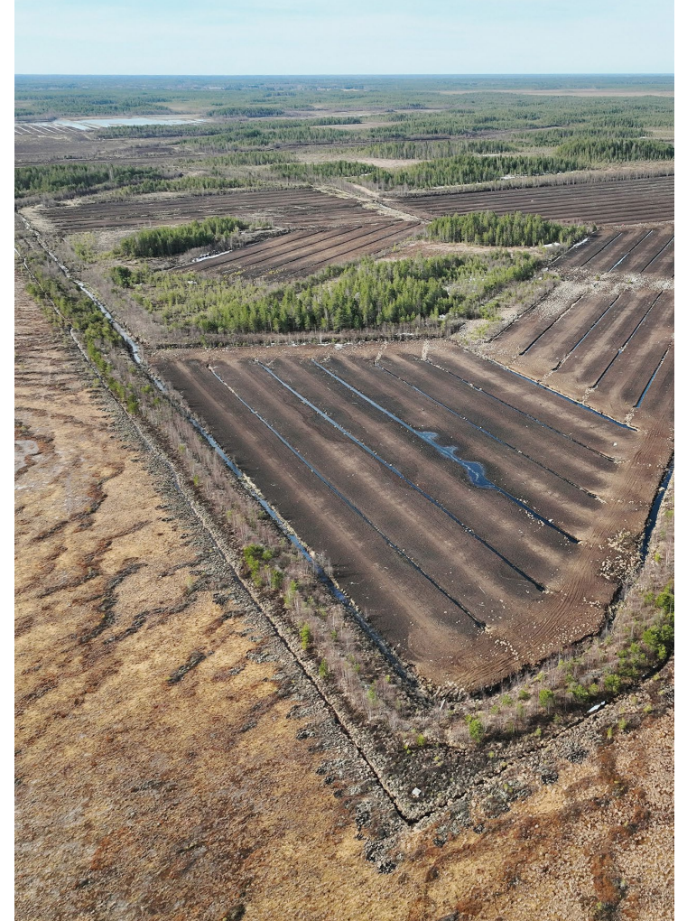
Kanasuo, Muhos, 134 ha